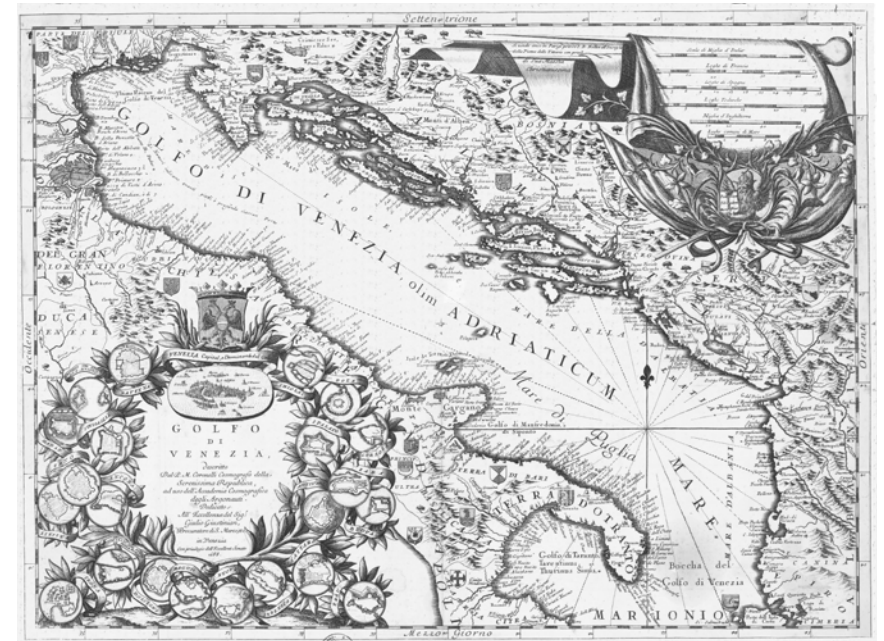
(Vincenzo Coronelli, Golfo di Venezia , 1688)